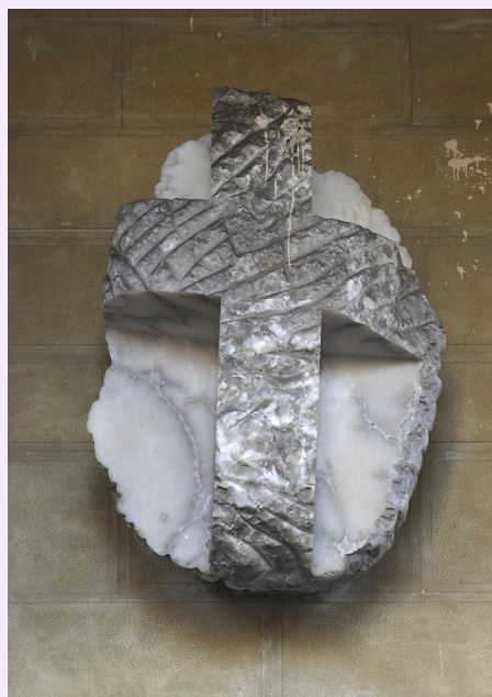
Eduardo Chillida, Cruz de la Paz, 1966