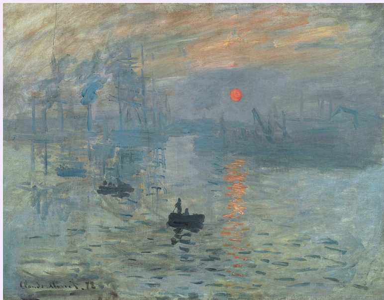
Claude Monet, Impresión, Sol naciente , 1872