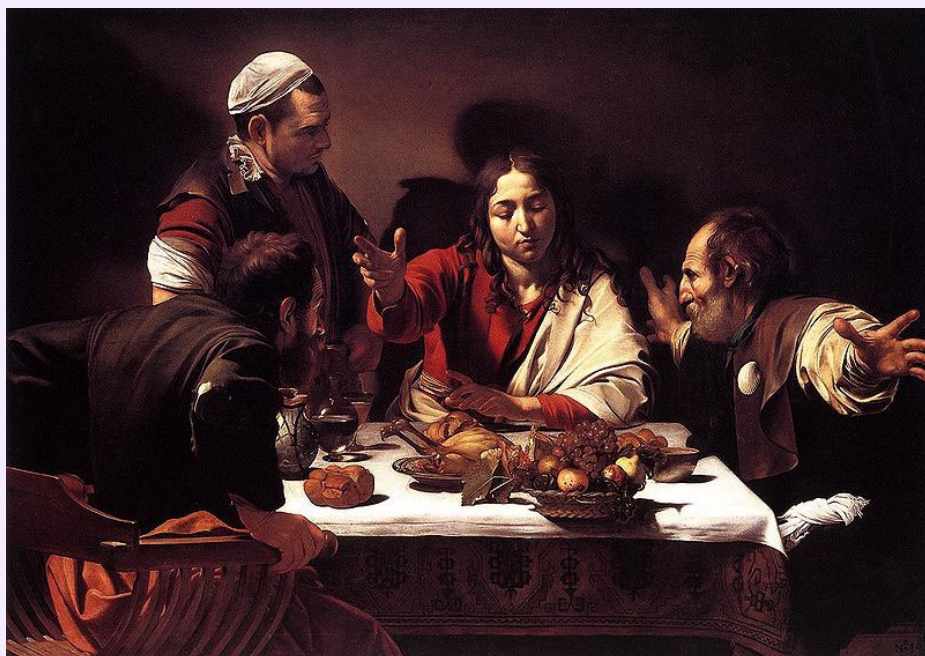
Caravaggio, La cena de Emaús, 1600