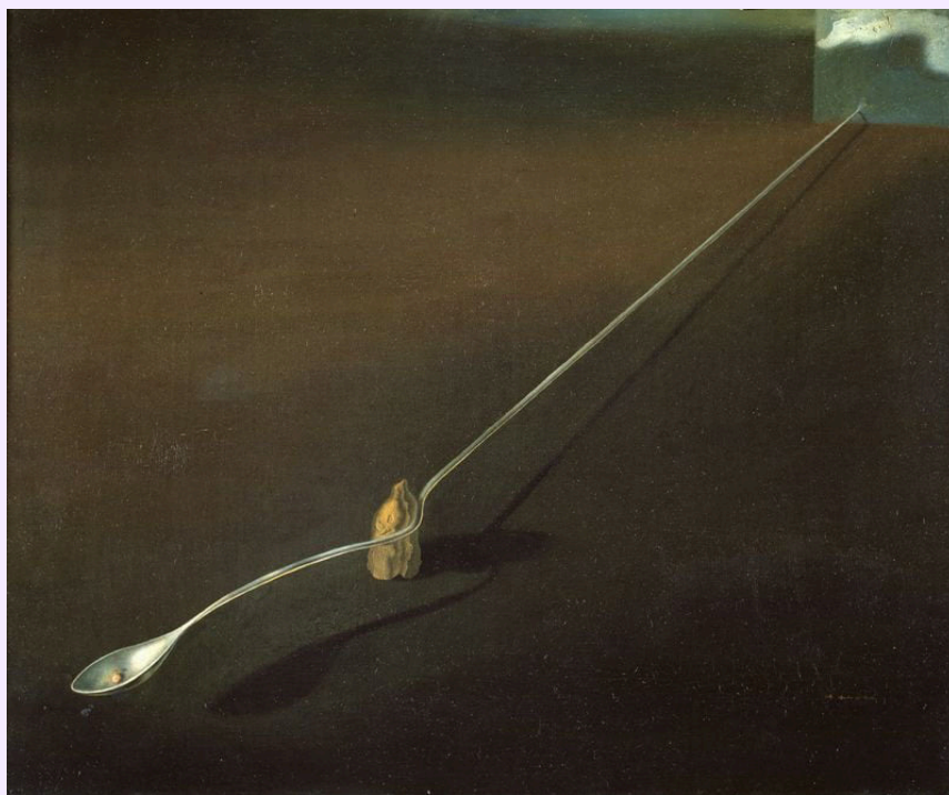
Salvador Dalí, Símbolo agnóstico , 1932