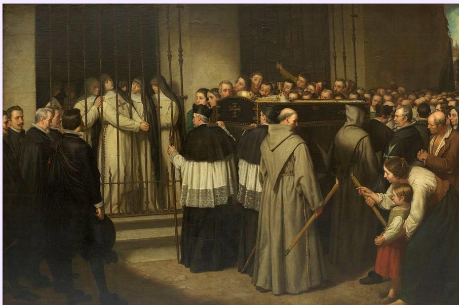
Sor Marcela de San Félix viendo pasar el entierro de su padre, Lope de Vega. Ignacio Suárez Llanos. 1862