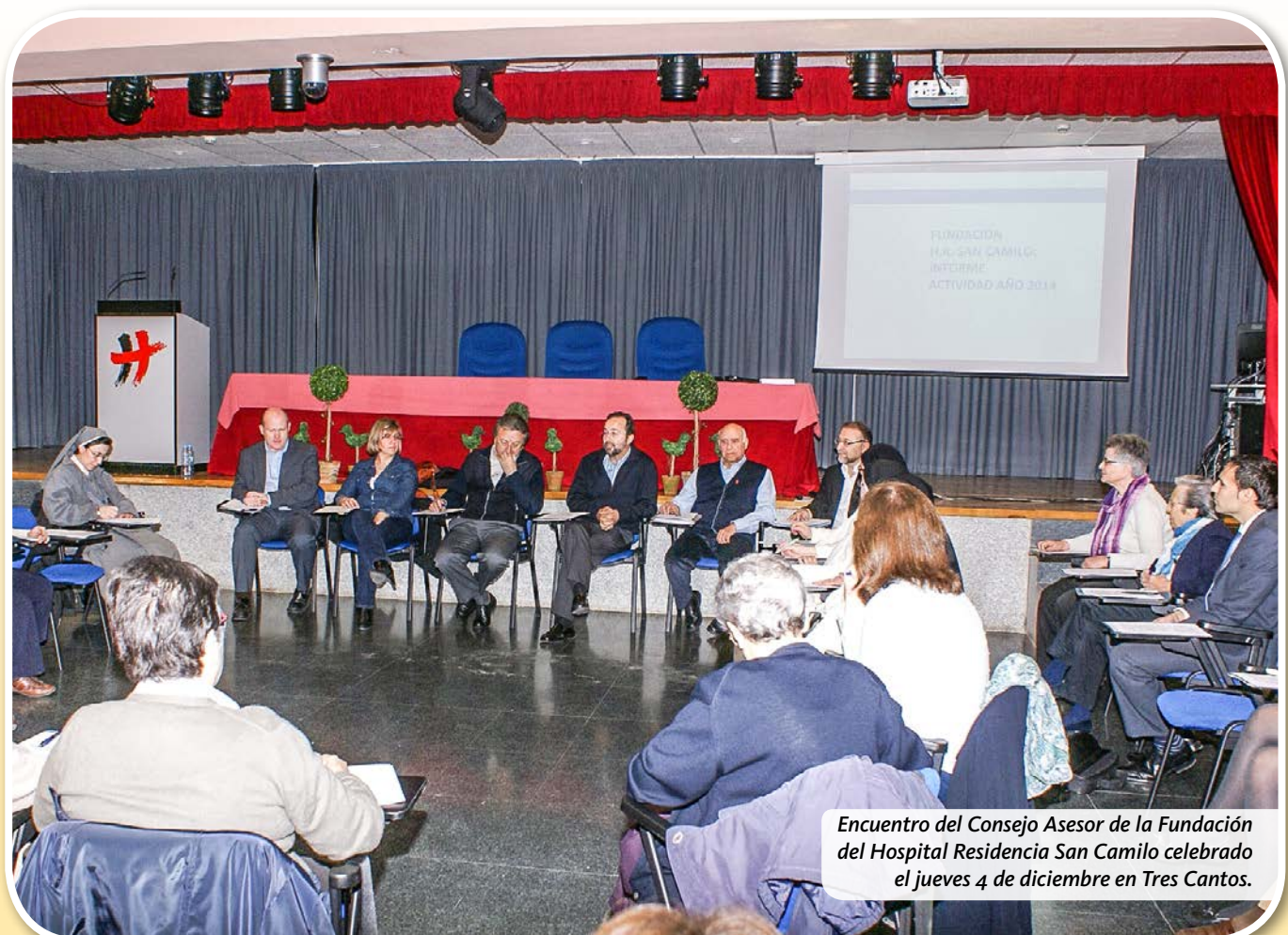
Encuentro del Consejo Asesor de la Fundación del Hospital Residencia San Camilo celebrado el jueves 4 de diciembre en Tres Cantos.