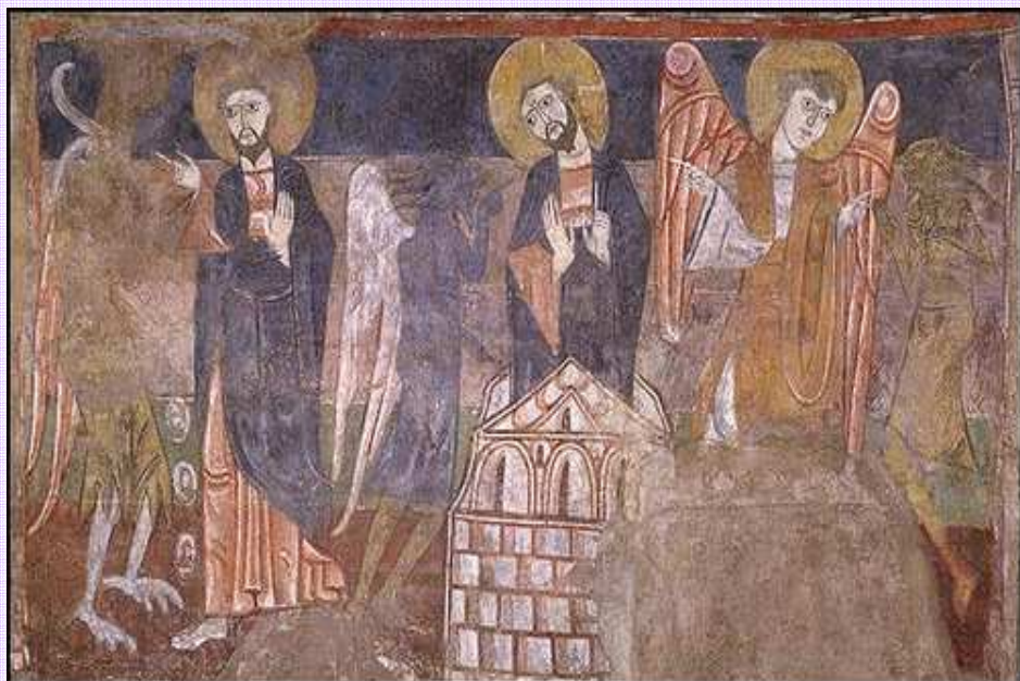
Tentación de Cristo. Ermita de San Baudelio de Berlanga. 1125