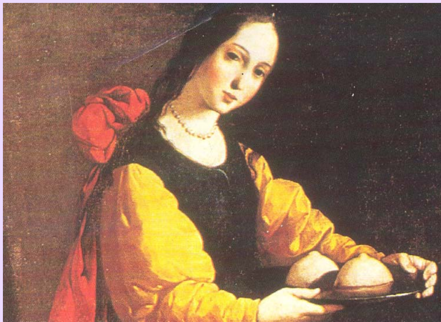
Francisco de Zurbarán. Santa Águeda S.XVII (1630-1633)