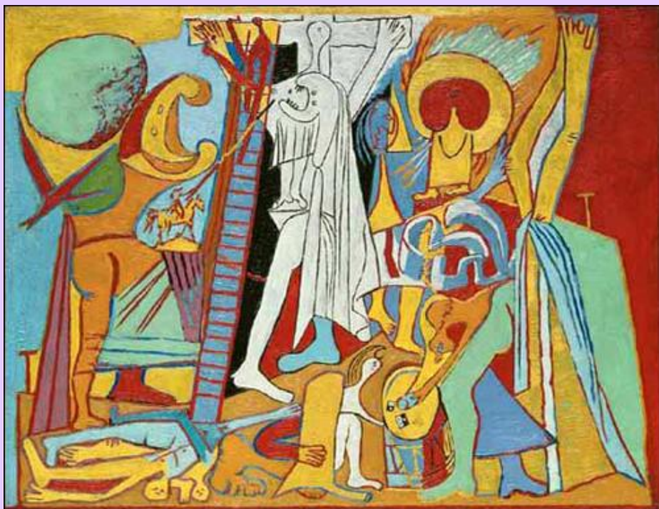
P. Picasso. Crucifixión. 1930