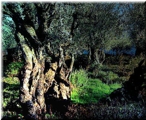
Olivos de Getsemani

Busca 10 palabras de m s de cuatro letras que aparecen en el evangelio de hoy: Jn 12, 20-33. Con las letras que sobran obtendr s una frase. Si la descubres, env a la frase a este correo: xabier@ancamilo.org y habr a un regalito.