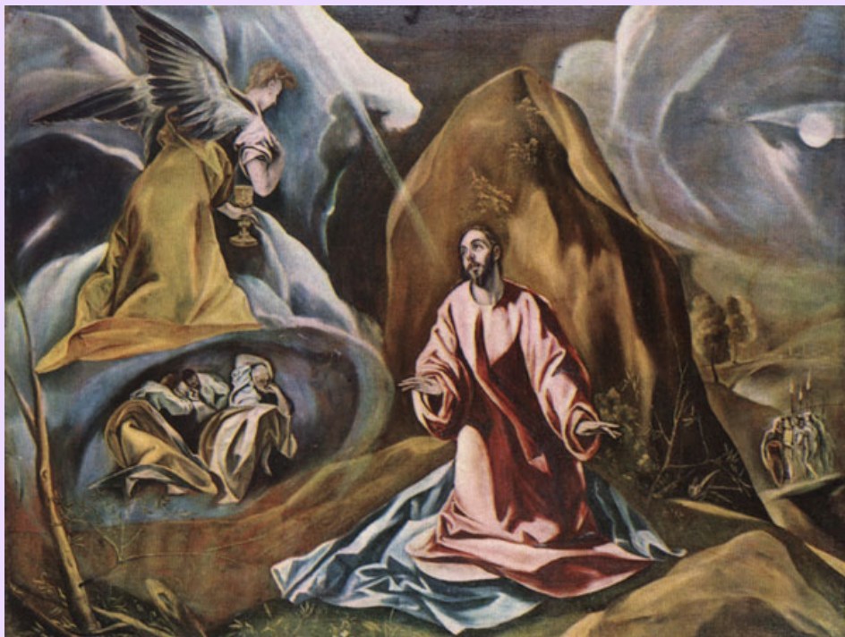
El Greco. Aeonía en Jerusalén.