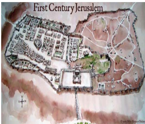
Jerusalén en el S.I

Busca 10 palabras de más de cuatro letras que aparecen en el evangelio de hoy: Jn 2, 13-25. Con las letras que sobran obtendrás una frase. Si la descubres, envía la frase a este correo: xabier@ancamilo.org y habrá un regalito.