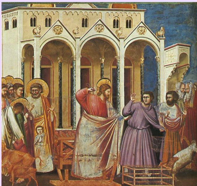
Giotto. Expulsión de los mercaderes del Templo. S.XIII-XIV.