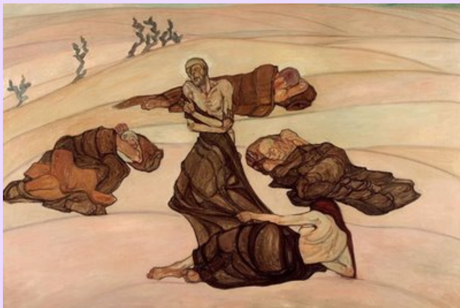
Reuven Rubin. Tentación en el desierto. 1922.