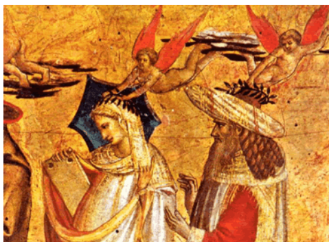
La Matemática conduciendo a Pitágoras. Fragmento de la tabla de Da Ponte Las Artes Liberales (1437). Museo del Prado.

Busca 10 palabras de más de tres letras que aparecen en el evangelio de hoy: Mc 1, 40-45. Con las letras que sobran obtendrás una frase. Si la descubres, envía la frase a este correo: xabier@sancamilo.org y habrá un regalito.