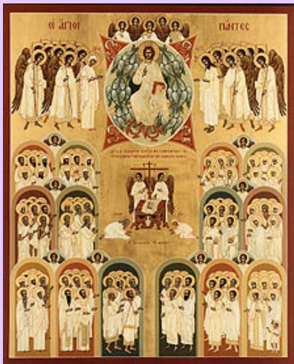
Icono de Todos los santos