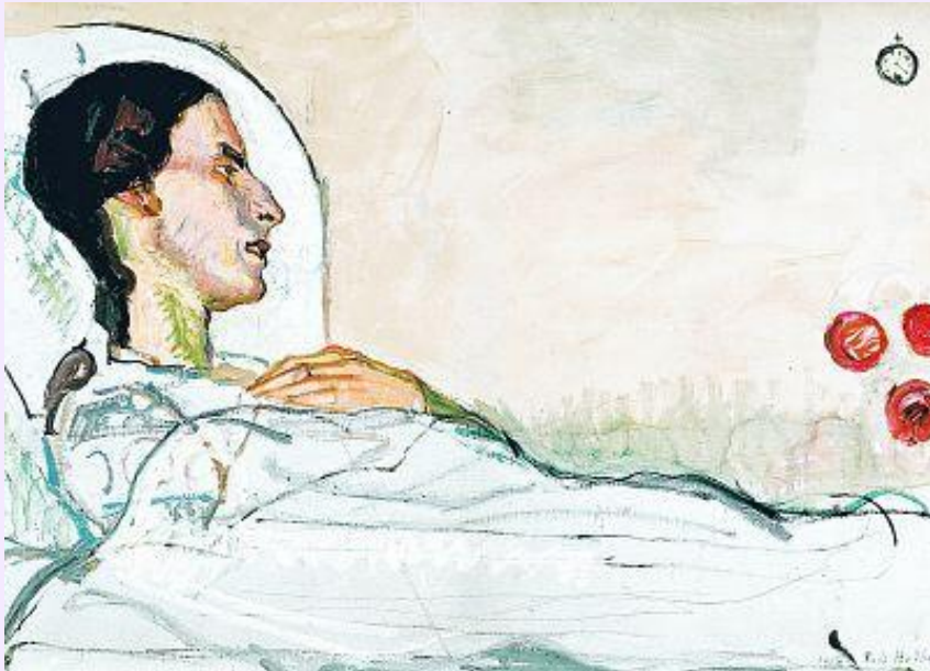
Ferdinand Hodler. « Enferma con rosas y reloj»