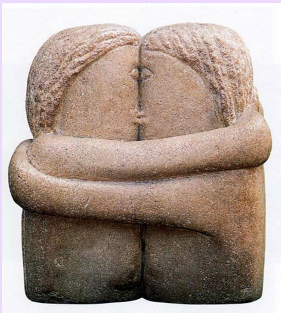
Constantin Brancusi. « El beso » 1907».