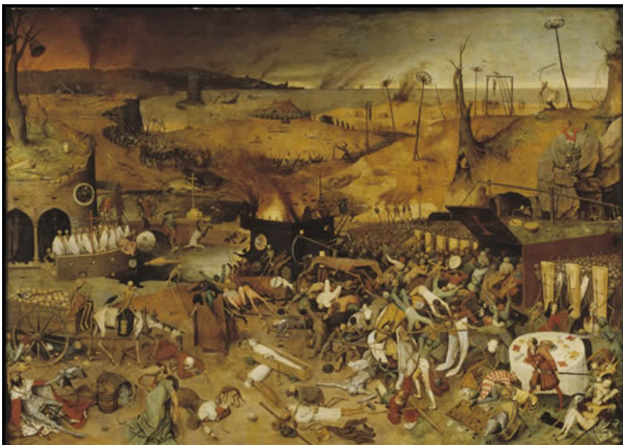
Pieter Bruegel (el Viejo). Triunfo de la muerte (1562-63)