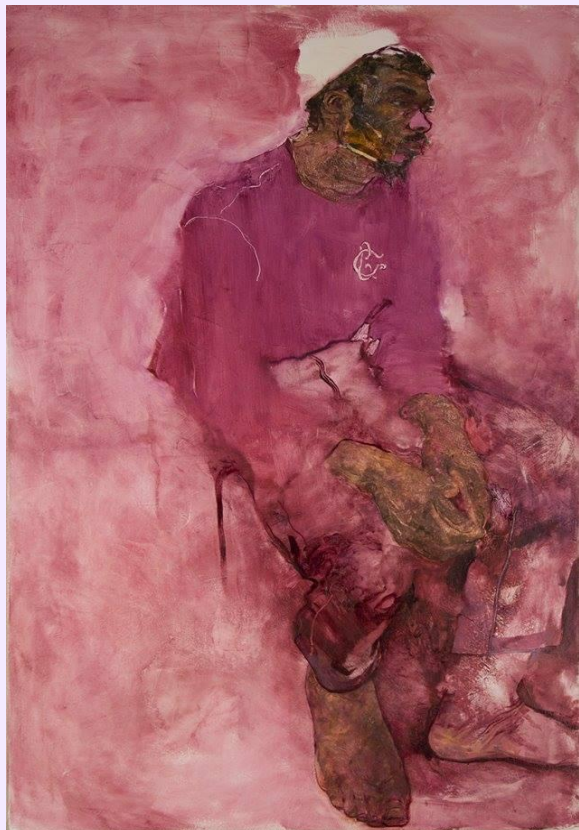
Jennifer Packer, Iván, 2013.