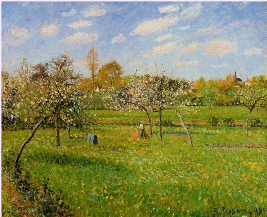
Camille Pissarro, Mañana de primavera, nubes, Eragny . 1900