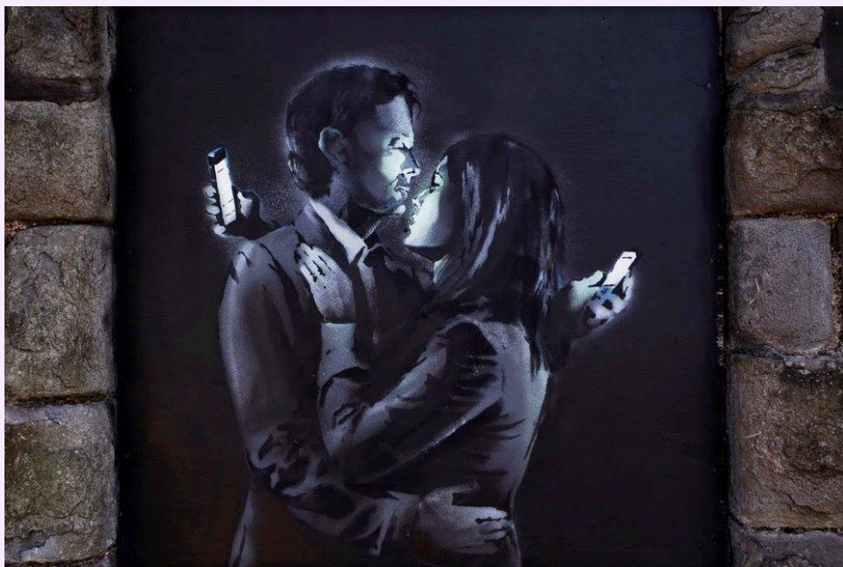
Banksy, Los amantes del movil , Bristol, 2014