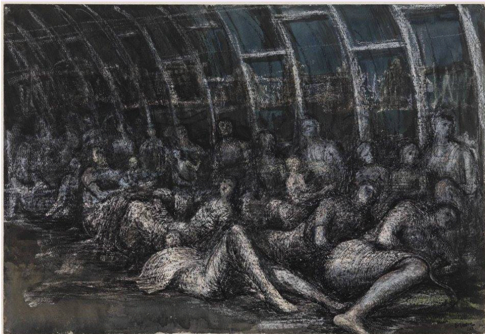
Henry Moore, Refugiados en el metro , 1941