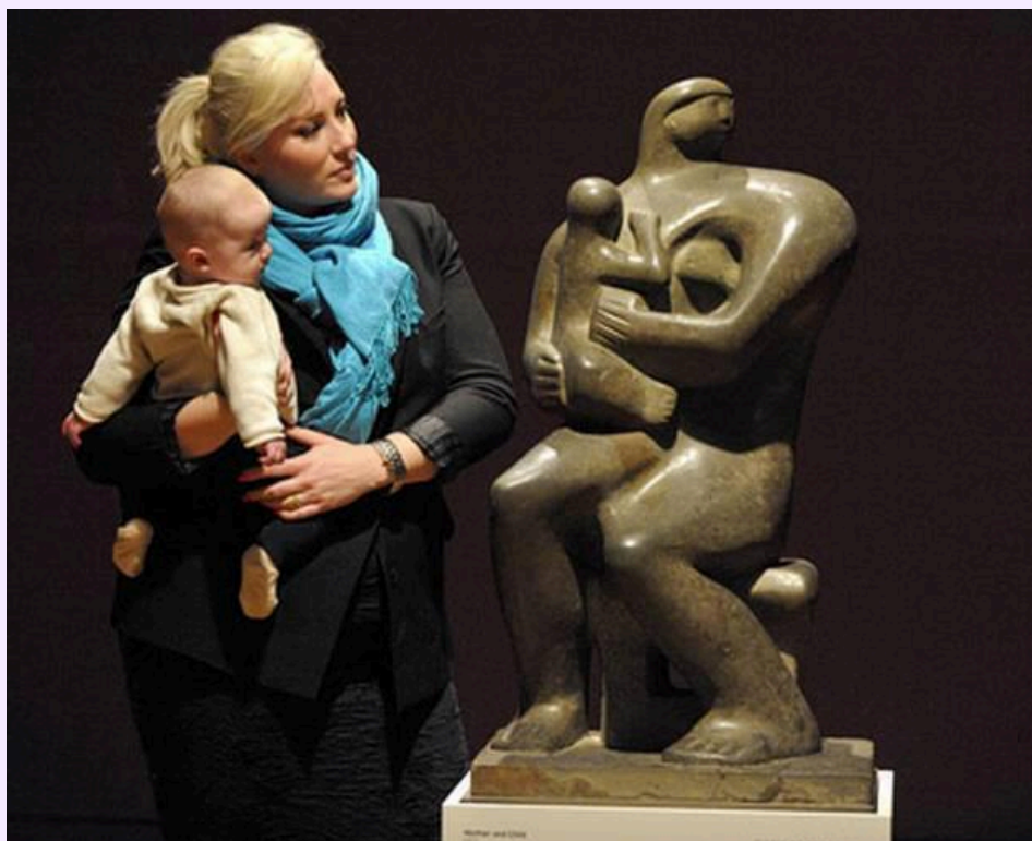
Henry Moore, Madre e hijo . 1932, Piedra.