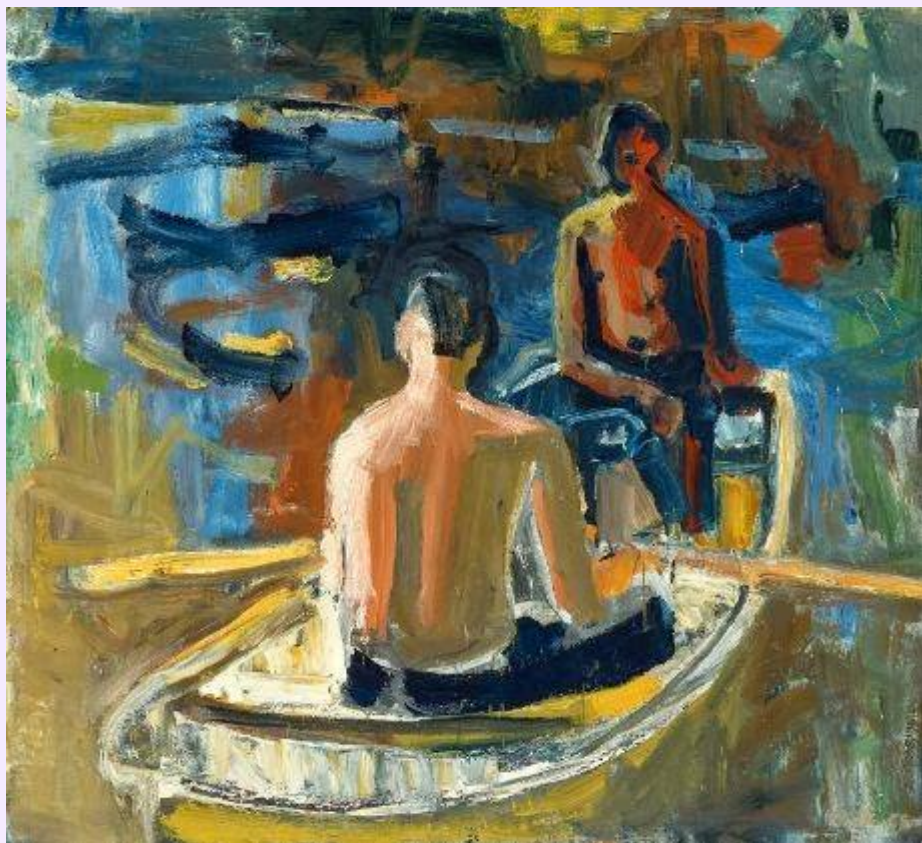
David Park, Bote de remos, 1958, Óleo sobre lienzo.