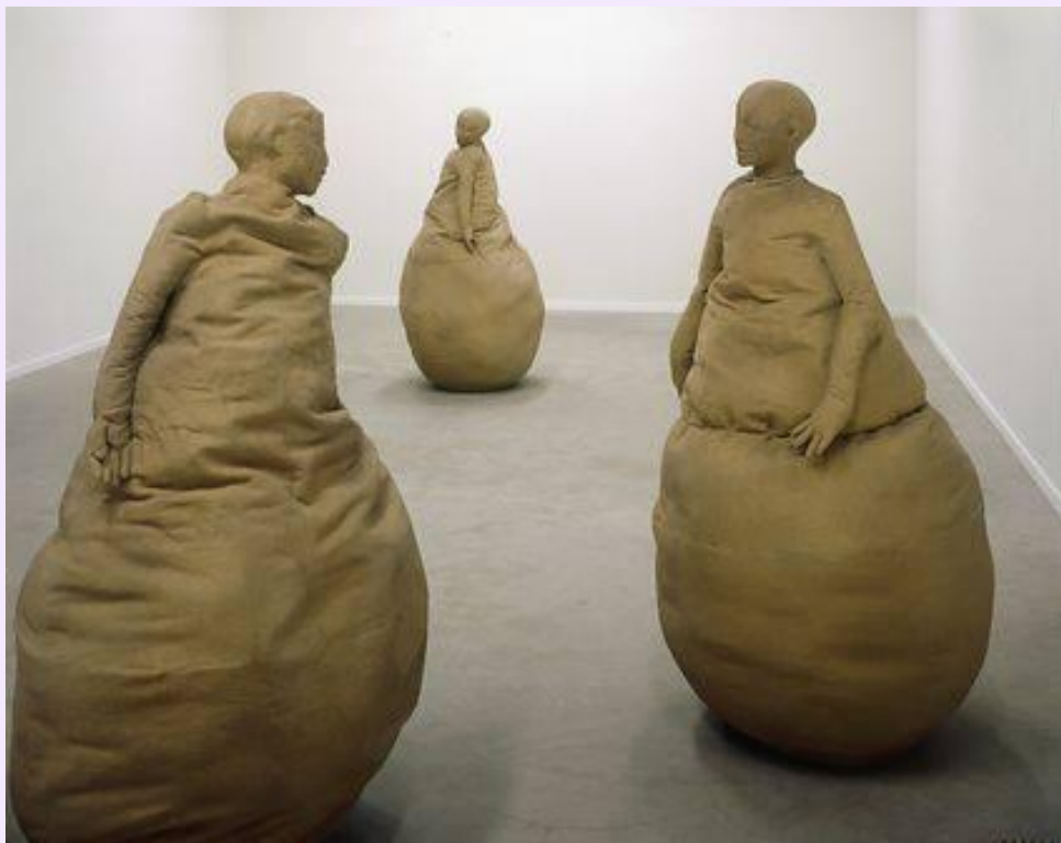
Juan Muñoz, Conversación , 1994. Arena, poliéster, fibra de vidrio.