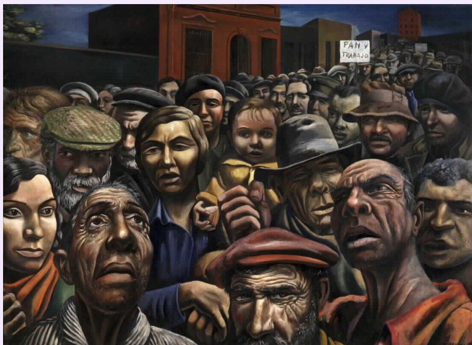
Antonio Berni. Manifestación. 1934