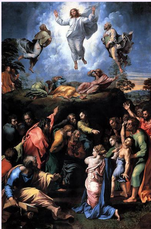
La Transfiguraciones. Rafael Sanzio. 1517-1520.