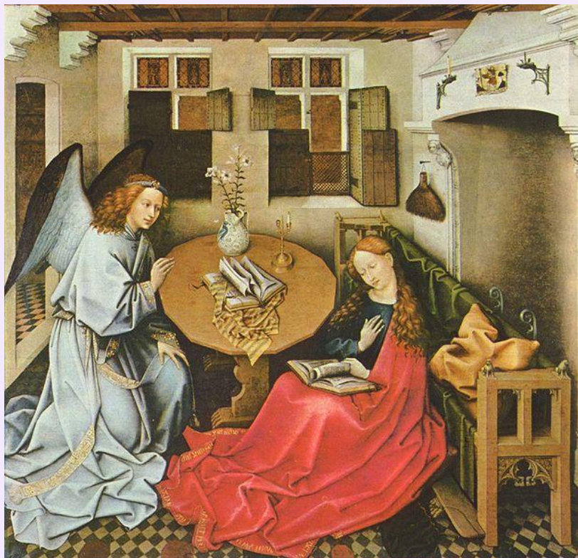
Robert Campin. Anunciación. 1420-1440