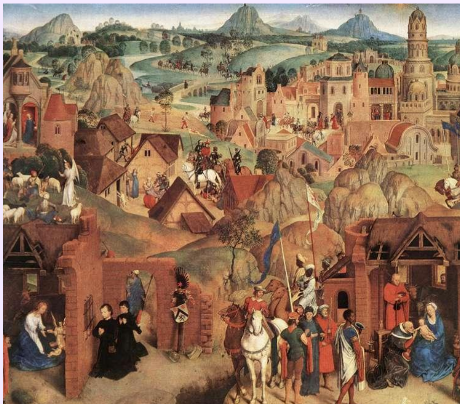
Detalle de “Adviento y triunfo de Cristo”. 1480